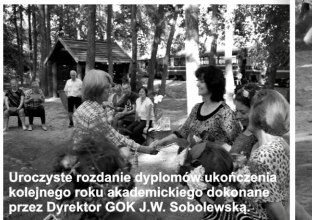
Uroczyste rozdanie dyplomów ukończenia kolejnego roku akademickiego dokonane przez Dyrektora GOK J.W. Sobolewską.

W ostania środę czerwca 2011 studenci Lesznowskiego Uniwersytetu Trzeciego Wieku spotkali się na peronie Piaseczyńskiej Kolejki Wąskotorowej, aby w radosnej atmosferze odbyć ostatnią w tym roku akademickim wspólną podróż. Skryci pod parasolami chroniącymi przed letnim deszczem, niosąc kosze piknikowe pełne wybornych przysmaków, gotowi na letnią przygodę zasiedli w wagonie pociągu. Plotąc wianki z kolorowych kwiatów oraz częstując się wzajemnie słodkościami podziwiali pejzaże pojawiające się za oknem. Soczysta zieleń lasu oraz zwolna rozpogadzające się niebo sprawiły wrażenie jakby pociąg porwał nas w daleką podróż na zastłuzone wakacje. Kolejka mknęła przez kwieciste łąki, mijając rzekę i staw kołysała nas delikatnie wprowadzając w błogostan. Nim się zorientowaliśmy nastąpiła króciutka przerwa. Na maleńkim, opuszczonym dworcu w Tarczynie rozprostowaliśmy kości, a wnuczęta- na chwilę spuszczone z oczu babć plądrując pobliskie krzaki i klomby wzbogaciły seniorskie wianki o łososiowe lilie i różowe malwy.