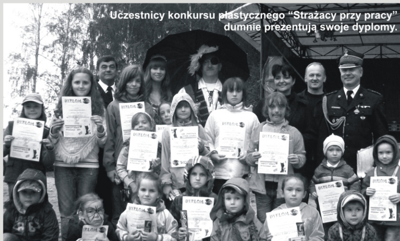
Uczestnicy konkursu plastycznego "Strażacy przy pracy" dumnie prezentują swoje dyplomy.