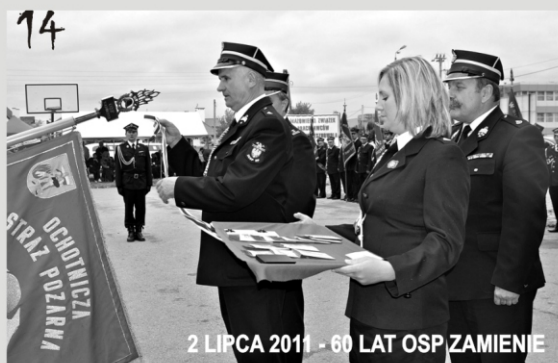
2 LIPCA 2011 - 60 LAT OSP ZAMIENIE