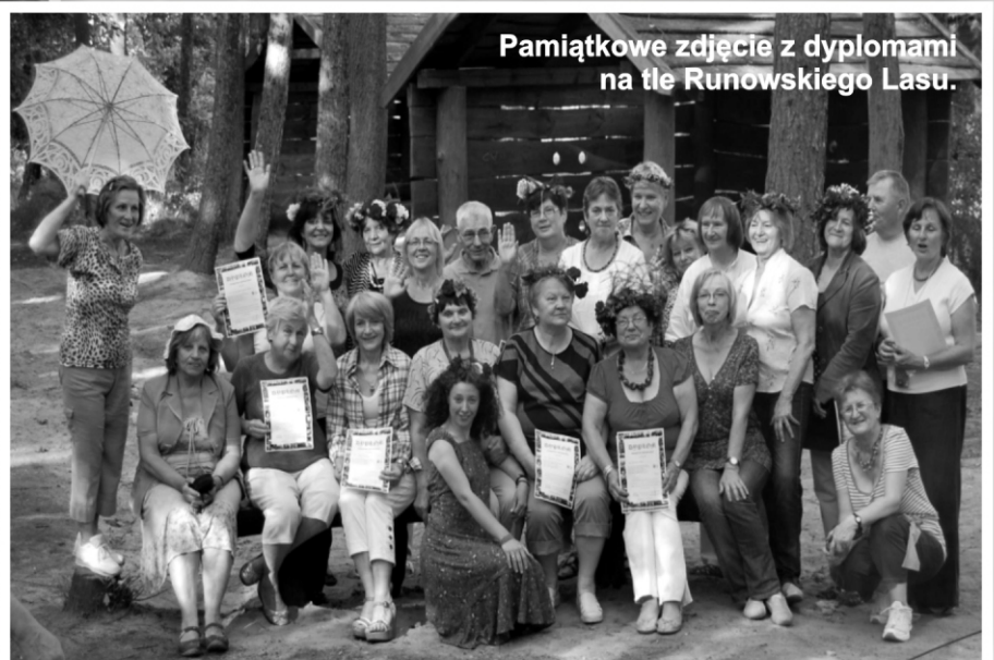
Pamiątkowe zdjęcie z dyplomami na tle Runowskiego Lasu.