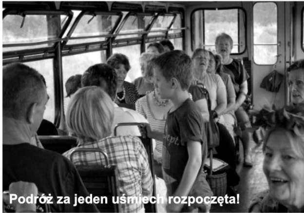
Podróż za jeden uśmiech rozpoczęta!