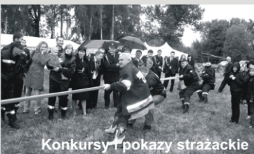
Konkursy i pokazy strażackie