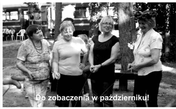
Do zobaczenia w październiku!