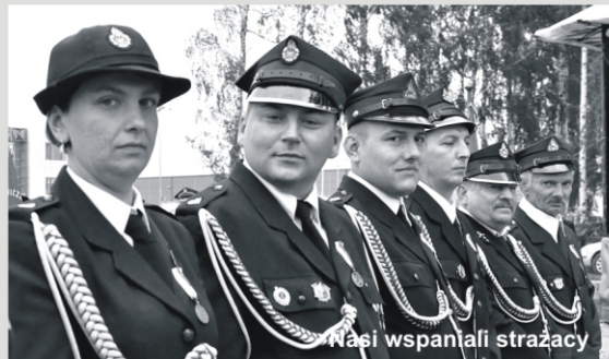
Nasi wspaniali strażacy