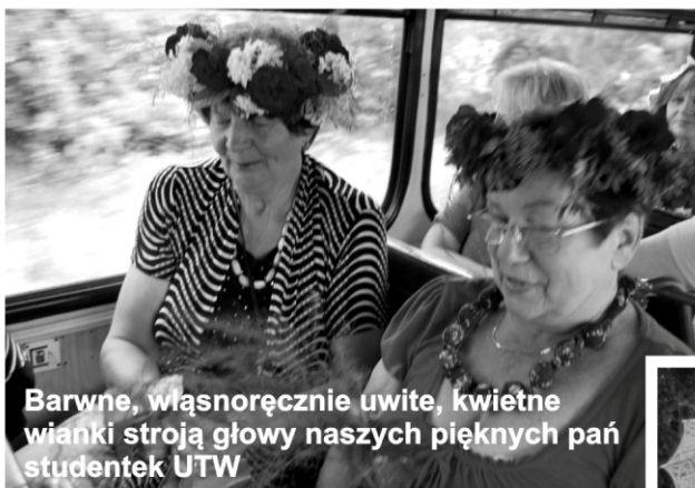
Barwne, własnoręcznie uwite, kwietne wianki stroją głowy naszych pięknych pań studentek UTW